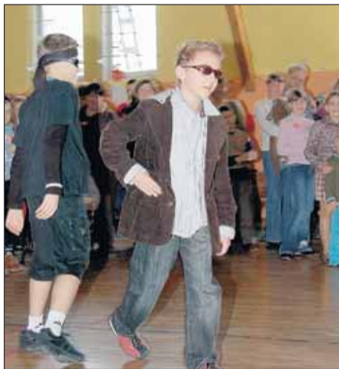
Pokaz mody szkolnej