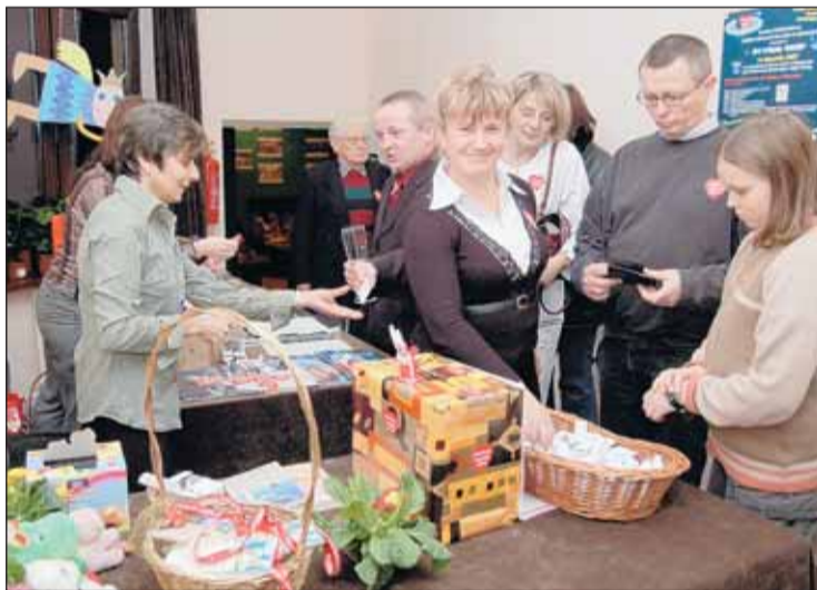
Loteria fantowa w GOK-u

Przez wiele godzin trwały licytacje przekazanych darów, wolontariusze z zapałem zbierali datki, zorganizowane były loterie fantowe i kawiarenki, z których dochód zasilili fundację WOŚP. Braлиśmy udział we wspólnych zabawach, oglądaliśmy specjalnie przygotowane na tę okazję występy. Przyjechały też do nas świetne zespoły (np. Stara Kuźnia), które wystąpiły charytatywnie. Razem z całą Polską wysłaliśmy nasze światełko do nieba... A pieniądze, które wpłacone zostały na konto WOŚP, przesyła nasze najsmielsze oczekiwania! To kwota blisko 35tys. zł! Posłużą one ratowaniu życia dzieci poszkodowanych w wypadkach oraz na naukę pierwszej pomocy. Jeszcze raz serdeczne podziękowania dla wszystkich, którzy wsparli nasz finał. Tak wspaniały efekt możemy osiągnąć tylko działając wspólnie. Zapraszamy do następnego finału, za rok, który razem zagramy!