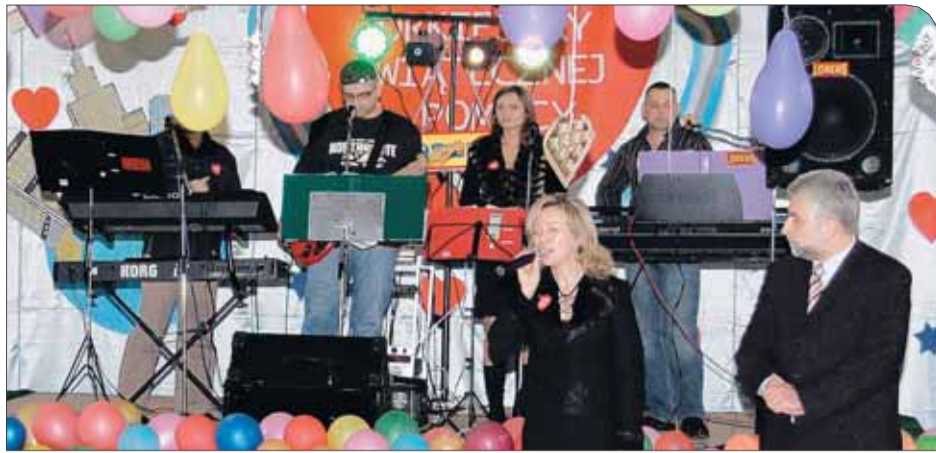
Uczestników finału WOŚP wita dyrektor szkoły i wójt gminy