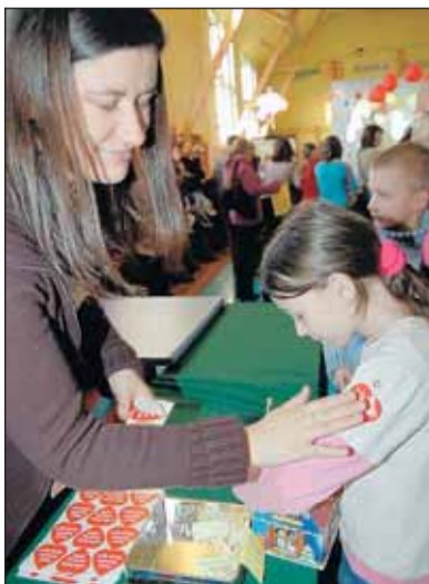
Serduszko za serce

8 stycznia odbył się bal kostiumowy z udziałem najmłodszych mieszkańców gminy – dzieci z Gminnego Przedszkola w Nieporęcie.