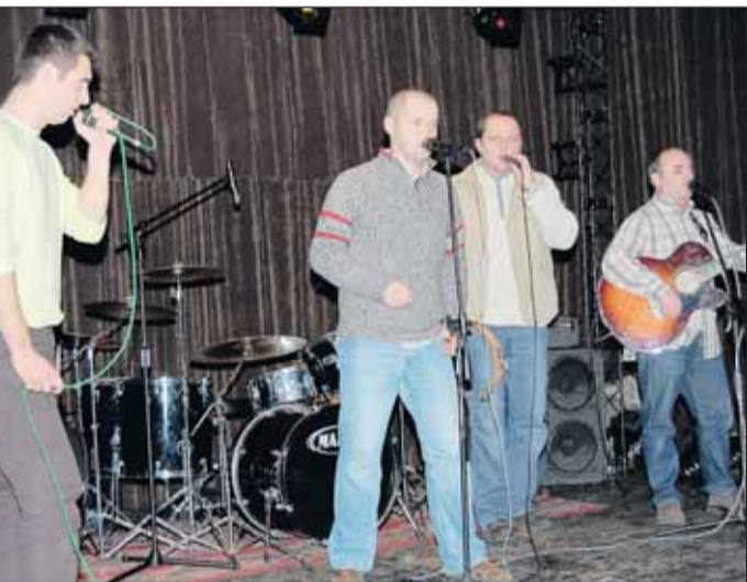
Kuźnia koncert szant