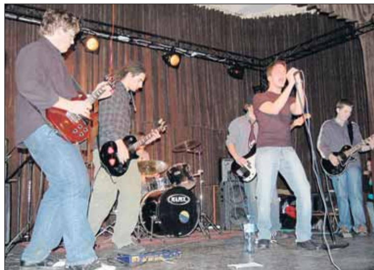
Występ zespołu The Rib