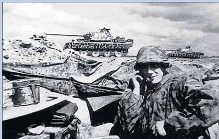
Polowy punkt łączności 5 Dyw. Panc. SS „Wiking” 1944r.