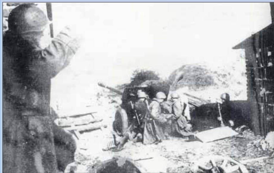
Stanowisko radzieckiej armii rejon Białoleki – jesień 1944r.