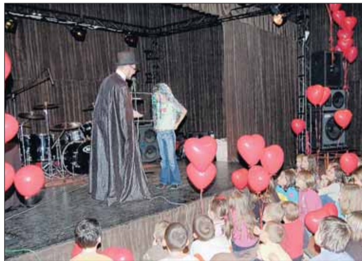
Spotkanie z iluzjonistą Tomaszem Bielińskim