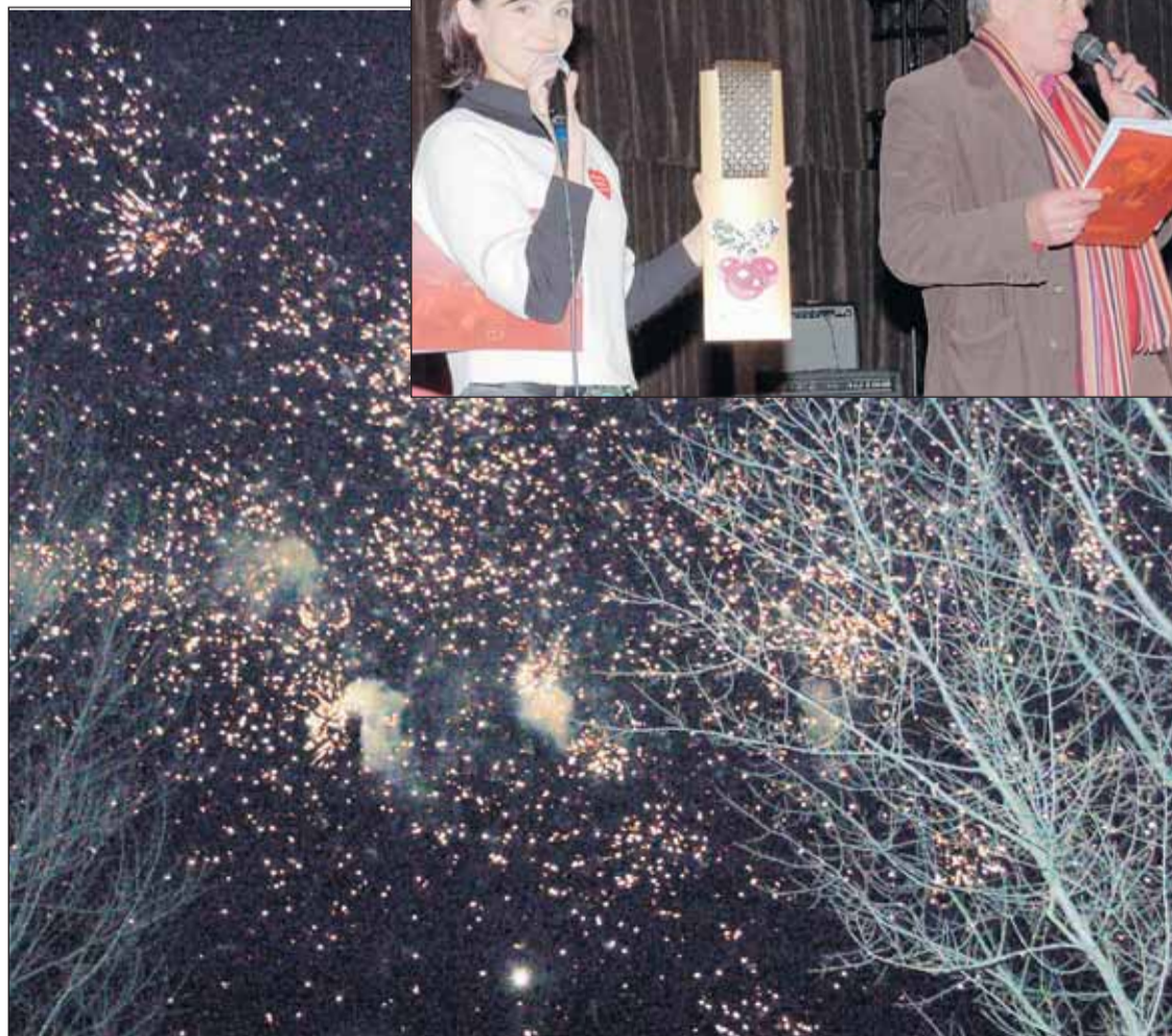
U góry: Licytacja. U dołu: Światełko do nieba